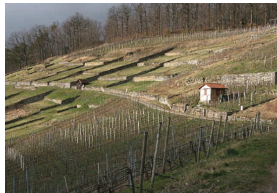
Weinberglandschaft Geigersberg mit Trockenmauern in Sachsenheim-Ochsenbach, Lkr. Ludwigsburg

Wir werden deshalb Zuwendungen, Vermächtnisse, Schenkungen und Nachlässe für die Arbeit unserer NATURLAND-Gesellschaft einsetzen. ■