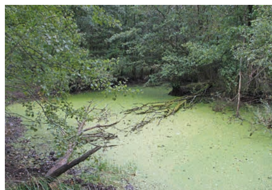
Verschlammter und verlandeter Weiher im Main-Tauber-Kreis