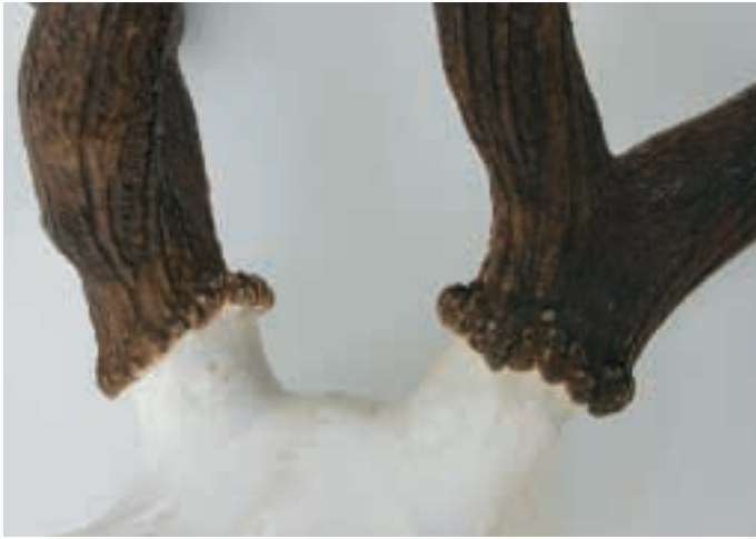
Rosenstöcke eines etwa siebenjährigen ungeraden Aichters (noch relativ lange Rosenstöcke) im Gegensatz zu einem etwa zwölfjährigen ungeraden Achtzehners. Geweihgewichte: 6,9 Kilogramm und 12,5 Kilogramm.