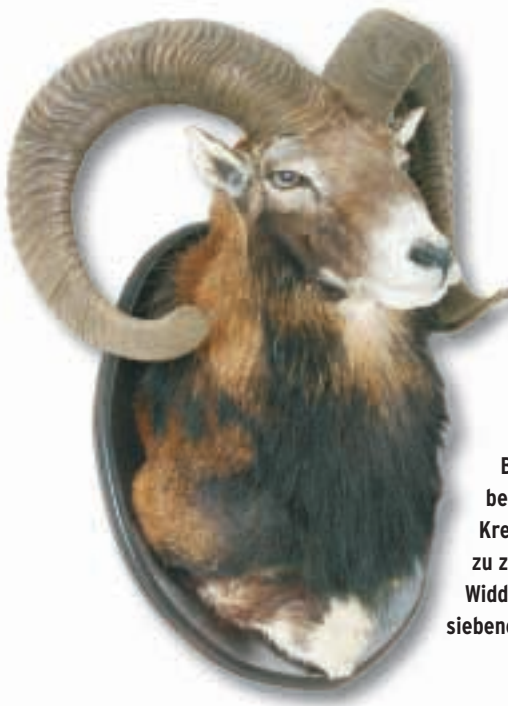
Bei entsprechender Auslage beziehungsweise weitem Kreisbogen kann auch ein nur zu zwei Dritteln durchgedrehter Widder reif sein. Hier ein siebeneinhalbjähriger.