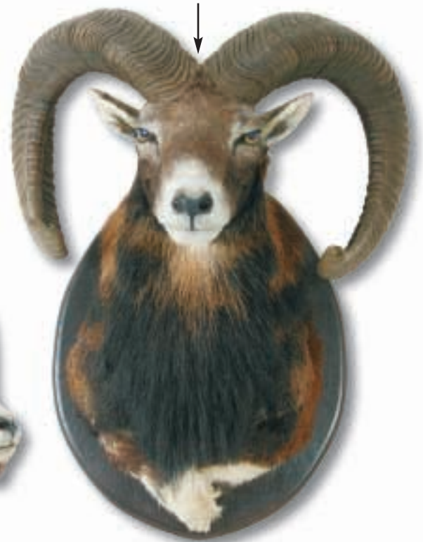
Ein Altersmerkmal - wenn auch kein sicheres - ist mit zunehmenden Alter der weitere Abstand der Schläuche an der Innenseite der Basis.