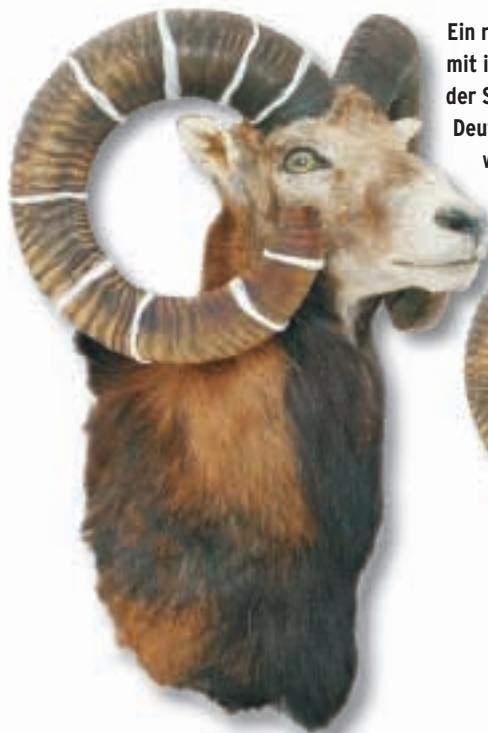
Ein reifer neuneinhalbjähriger Widder mit idealer Schnecke. An den Spitzen der Schläuche setzt er bereits zurück. Deutlich zu sehen ist hier die feiner werdende Rillung zur Basis hin.

Den Filmbeitrag zum Heft finden Sie auf der DJZ-DVD 2/2005