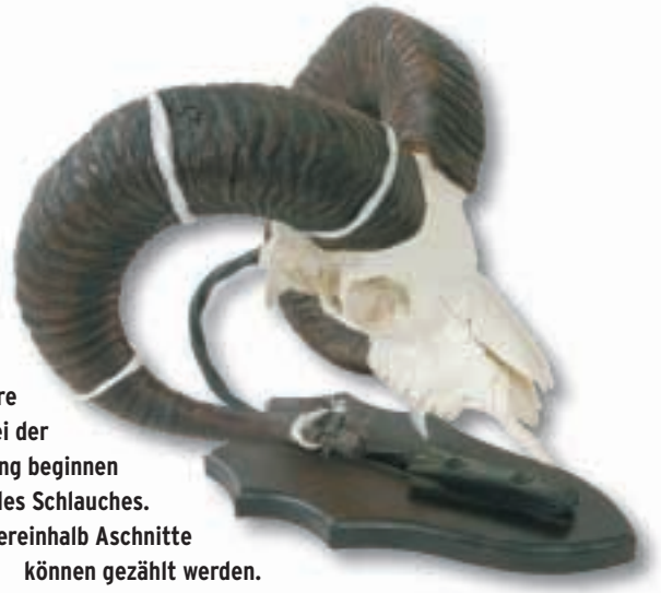
Ein viereinhalb Jahre alter Widder. Bei der Altersbestimmung beginnen wir am Ende des Schlauches. Das bedeutet hier: viereinhalb Aschnitte können gezählt werden.