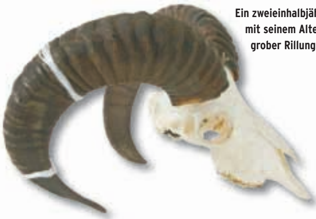
Ein zweieinhalbjähriger Widder mit seinem Alter entsprechender grober Rillung.

Das Schmalschaf hat mit Beginn der Jagdzeit den I1 (Dauer-