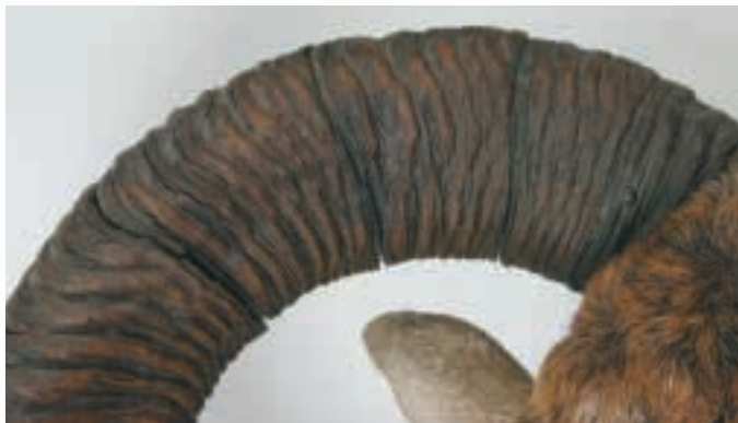
Die Jahresrillen im ersten Drittel der Schnecke von der Basis aus. Die Jahresrillen sind feine Verdichtungen, entstanden durch das Stoffwechseltief.

Zur Erfassung des Kahlwildes, also Kalb, Schmaltier und Alttier gibt die Zahnentwicklung eindeutige Hinweise (sinngemäß gilt das natürlich auch für die jungen Hirsche). Wer also anhand des Habitus nicht sicher ist, ob