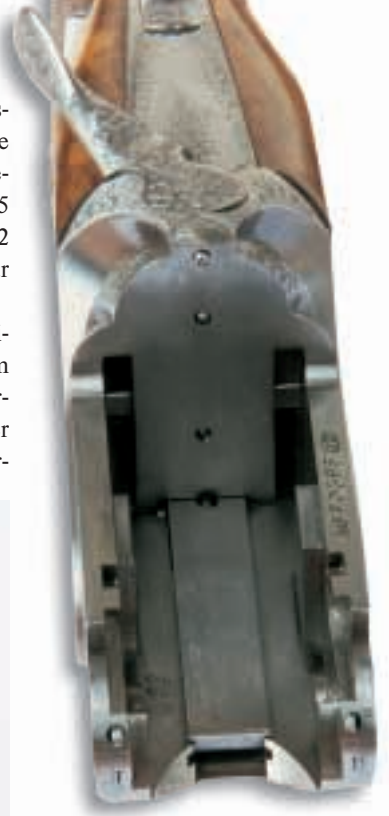
Sauber verarbeitete Basküle mit BOSS-Verriegelung und verdeckten Spannstangen.