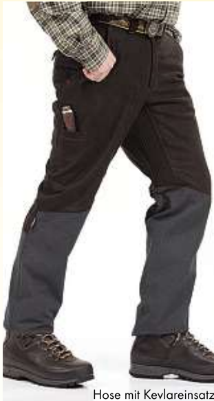
Hose mit Kevlareinsatz

Hose komplett aus mittelbraunem Vollleder (ohne Knie- und Kehl-naht) oder mittelbraunes Nubukleder mit Kevlareinsatz im unteren Beinbereich.